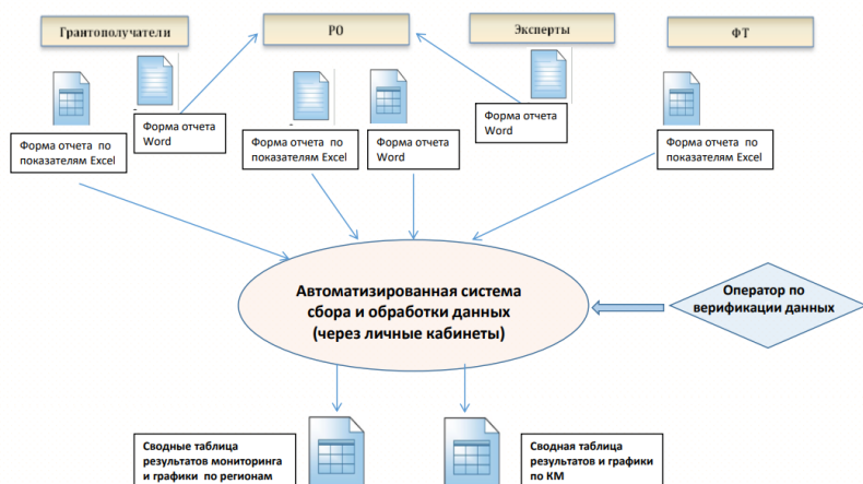
Схема сбора и обработки данных мониторинга