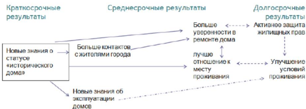
Рисунок 3. Теория изменений для жильцов дома Шилля

В более развёрнутом виде теория изменений для жильцов Дома Шилля представлена ниже. Пунктиром отмечены потенциальные связи между результатами в долгосрочной перспективе, что выходит за рамки анализа.