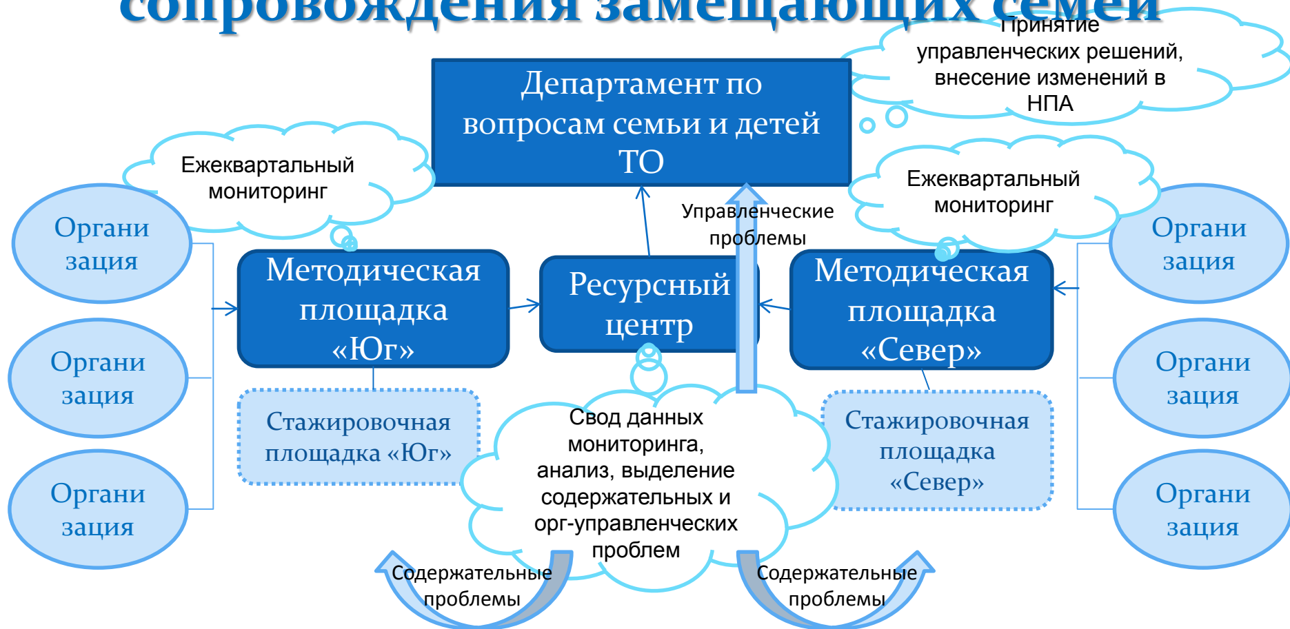
Схема проведения мониторинга качества сопровождения замещающих семей